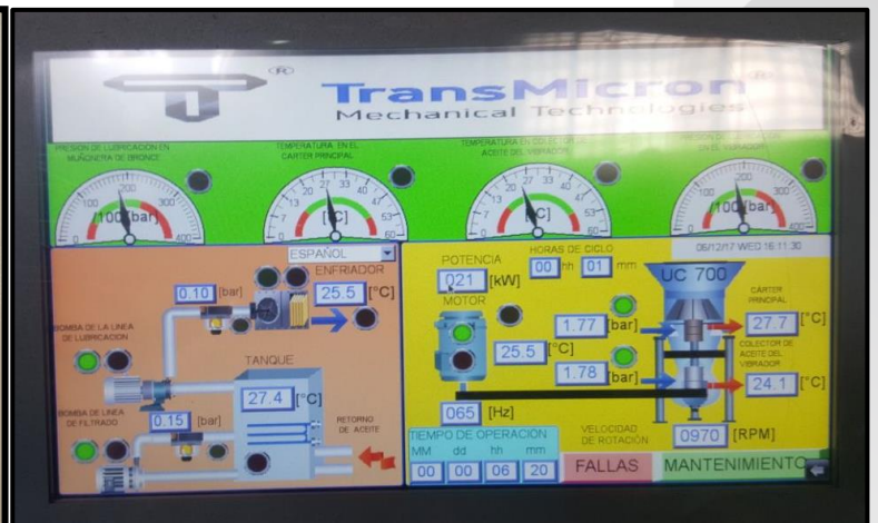
Captura de pantalla táctil de panel de control.

Las dimensiones de Panel de Control y Estación de Aceite se especifican en los esquemas de instalación.