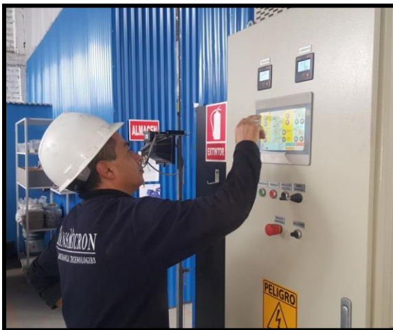
Panel de control UC-SERIES®

El panel de control incluye un variador de frecuencias y cuenta con una pantalla táctil, desde la cual se pueden monitorear los parámetros de funcionamiento del equipo. Además, cuenta con un sistema de monitoreo y control inalámbrico, es decir, se puede controlar desde cualquier dispositivo conectado a internet o que esté conectado a la misma red local.