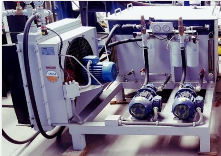
Estación de aceite UC-SERIES®

La estación de aceite de los equipos UC-Series® incluye el sistema de lubricación de la máquina.